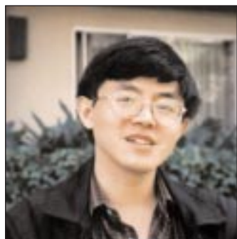
Dr. Wan Yanhai

Quand le Réseau s'est joint à Human Rights Watch pour créer les Prix de l'Action contre le VIH/sida et pour les droits humains , au début de 2002, on ne savait pas que l'annonce du premier récipiendaire international arriverait à un moment si crucial. Quelques semaines avant que le Dr Wan Yanhai (un activiste anti-sida parmi les plus reconnus et les plus éloquents en Chine) se rende au Canada pour recevoir son prix à l'occasion de notre a.g.a. de 2002, les autorités chinoises l'ont emprisonné. On l'accusait